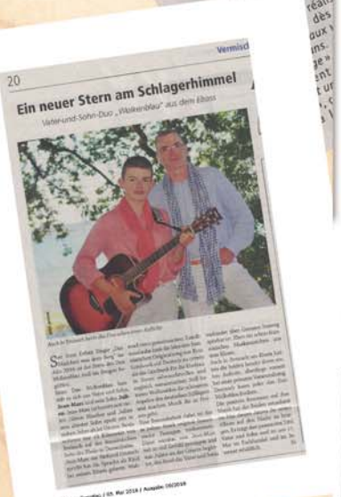
Ein neuer Stern am Schlagerhimmel

« Il y a une ambiance typique d'outre-Rhin, on s'y sent bien »