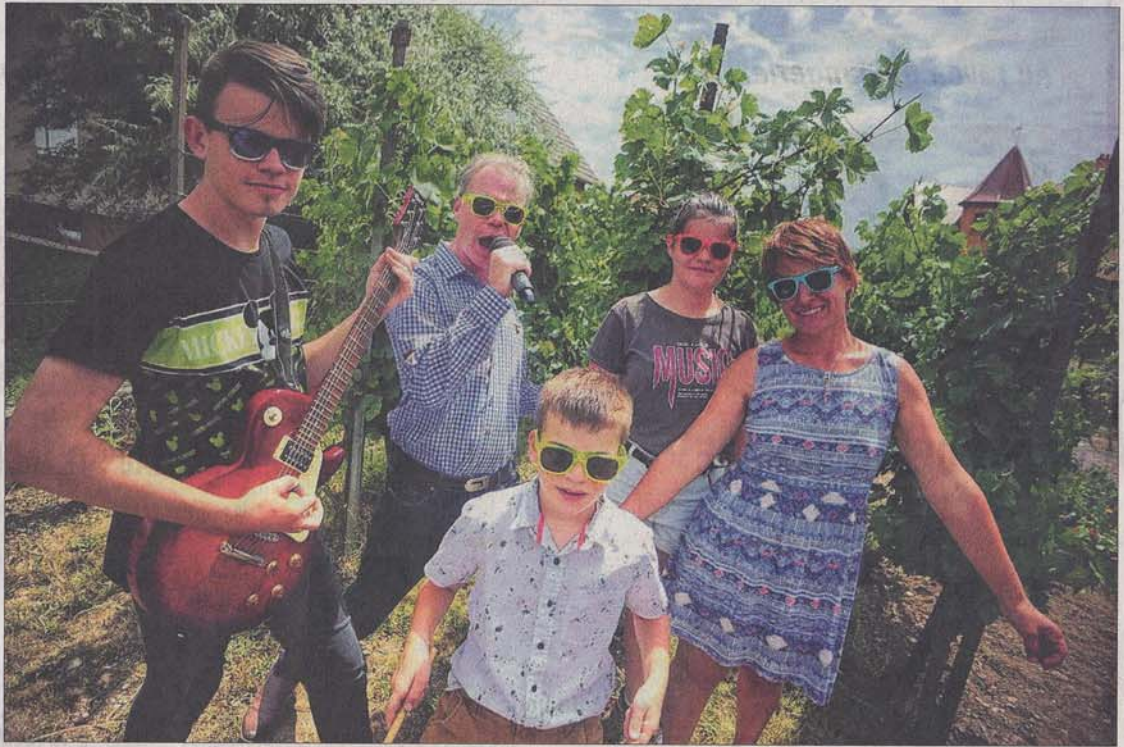
Wolkenblau, la famille musicienne qui fait des étincelles sur les terres où le schlager est roi, assurera l'ambiance « après-ski » du chalet de la Foire aux vins tous les après-midis.

Au programme, des titres de Wolkenblau mais aussi un hommage au genre schlager. « L'intérêt est aussi de ne pas faire tout le temps la même chose ». Ce sera aussi l'occasion d'évoquer l'actualité du groupe de Dessenheim qui enchaîne les succès sur les terres où le schlager est roi. Il a notamment terminé deuxième